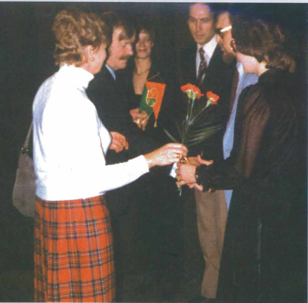
10-vuotisjubilintaa v. 1983