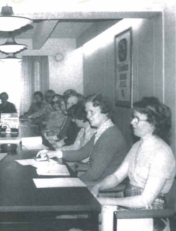
Perhepäivähoitajat liittymässä yhdistykseen kesällä 1976

Yhdistyksen talohanke lähti myös näihin aikoihin liikkeelle: "Toimikunta päätti rakennuttaa Talvisalo 1 asemakaava-alueelle 18 perheen kerrostalon - - -". Voe tokkiisa!